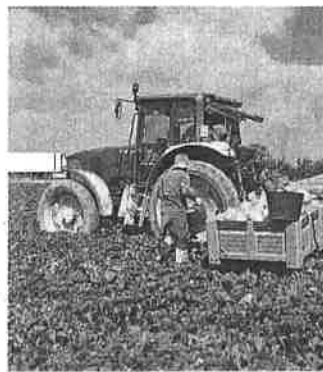
Un 90% de los fondos llegará de la UE.

Las políticas de agricultura, pesca y alimentación estarán dotadas el año que viene con 8.844 millones de euros, lo que supone un incremento del 5,2% respecto a 2021. Un 90% de los recursos para la agricultura y la pesca llegarán desde la Unión Europea en 2022; de ellos, 504 millones provendrán del mecanismo de recuperación, según las cuentas presentadas ayer por el Gobierno. Habrá 133 millones para facilitar la transición ecológica de la agricultura y la ganadería y combatir las plagas. Y se destinarán 4.200 millones para digitalización y movilidad rural, para instalación de 5G y para la mejora de la competitividad