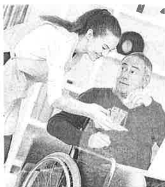
El Ejecutivo prevé 2.900 millones en esta partida.

Para un Gobierno que enarbola la bandera de lo social, una capítulo esencial es la atención a la dependencia. El Ejecutivo ha destinado un total de 2.904 millones de euros al Programa de Autonomía Personal y Atención a la Dependencia, un 23,3% más que en las Cuentas de 2021. El objetivo de este salto cuantitativo es, según el Gobierno, "avanzar en el grado de protección a las personas y colectivos sociales más vulnerables". Además, el Mecanismo de Recuperación y Resiliencia permitirá canalizar 726 millones de euros para el plan de apoyos y cuidados de larga duración, destinado a financiar nuevos equipamientos públicos y domiciliarios.