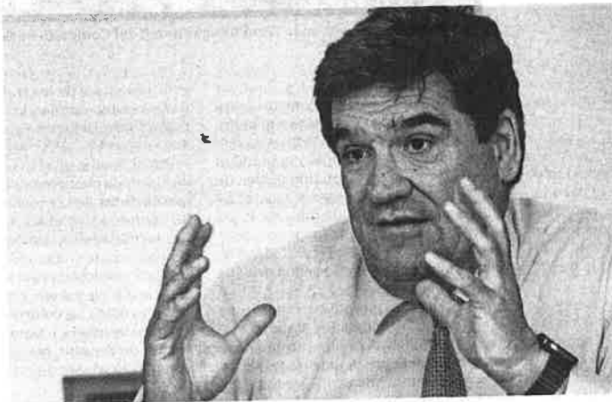
El ministro de Inclusión, Seguridad Social y Migraciones, José Luis Escrivá.

bierno. Así, entre los ERTE y los autónomos que cuentan con este auxilio hay medio millón de afiliados a la Seguridad Social que aún no han vuelto a la normalidad. Es por esto que los empresarios piden celeridad para dar comienzo de nuevo a las negociaciones y así evitar que ocurra lo que pasó en la última prórroga, cuando el pacto se alcanzó en el último momento.