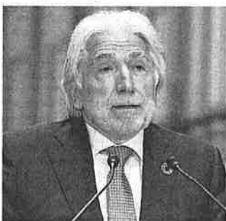
JOSEP SÁNCHEZ LLIBRE Presidente de Fomento del Trabajo

"La recuperación está acelerándose. Pero no sólo es importante la salida de la crisis, sino también cómo salimos de ella. Lo ideal sería no tener que hacerlo como en anteriores crisis; es decir, devaluando costes, sino hacerlo con una economía de valor añadido. Para ello, son fundamentales políticas fiscales laxas para generar más base imponible y favorecer las inversiones, un marco laboral más flexible, y una gestión adecuada de los fondos europeos".