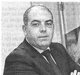
LORENZO AMOR Presidente de ATA

"Hay riesgos asociados a la posibilidad de que se complique el control de la pandemia por la extensión de nuevas cepas del virus y, por otra parte, por las débiles condiciones de solvencia en las que un gran número de empresas van a encarar la recuperación tras un año y medio de tan graves dificultades. La recuperación no será sostenible, en cualquier caso, si no acometemos las reformas estructurales pendientes".