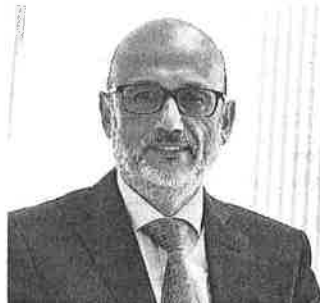
MANUEL PÉREZ SALA Presidente del Círculo de Empresarios

en los próximos meses, pero advierten de que son indispensables reformas estructurales para que el crecimiento sea sostenible. Reclaman un marco laboral flexible para que las empresas puedan adaptar sus plantillas a la evolución de la demanda.