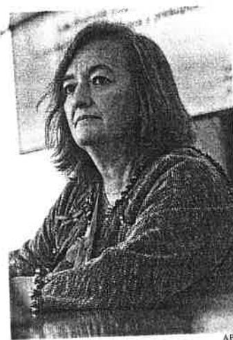
Cristina Herrero Presidenta de la Airef

La medida supone que el importe total de los recibos de la luz serán un 11% más baratos. Por ejemplo, una factura de 60 euros se reducirá en 6,6 euros, hasta en 53,4 euros. Para otra de 50 euros, el ahorro será de 5,5 euros.