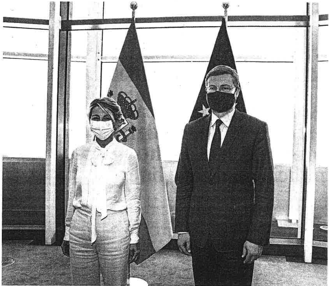
La vicepresidenta Yolanda Díaz, con el vicepresidente económico de la CE, Valdis Dombrovskis

La aclaración se ha hecho necesaria ante el doble discurso que ha mantenido el Gobierno de coalición con respecto a este tema y supone un antes y un después en el lenguaje de la Comisión Europea, tras meses apostando por una mayor sutileza. Fuentes comunitarias consultadas por este diario interpretan este hecho como un aviso claro al Ejecutivo que incluso podría determinar el nuevo rumbo del pulso interno que mantiene la coalición a cuenta de la reforma laboral. La ministra de Economía, Nadia Cal-