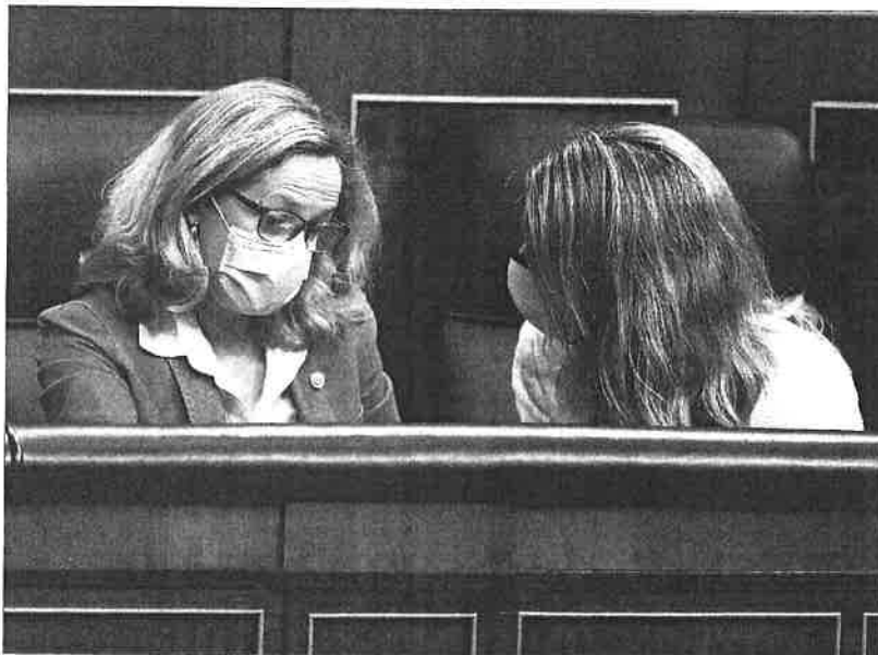
Las vicepresidentas Nadia Calviño y Yolanda Díaz, en el Congreso el pasado abril.

Con todas esas consideraciones, el texto del grupo recomienda al Gobierno dos vías posibles para retomar las subidas del salario mínimo, que en 2021 se habían paralizado en medio de la pandemia a la espera de este informe. Una vía consistiría en concentrar las subidas en 2022 y