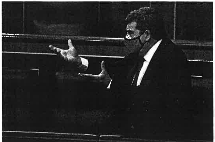
El ministro de Inclusión, Seguridad Social y Migraciones, José Luis Escrivá, durante la sesión de control al Gobierno el pasado miércoles en el Congreso.

Las estadísticas del ministerio indican, no obstante, que entre 160.000 y