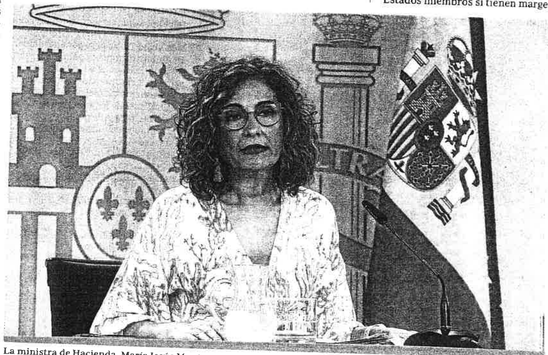
La ministra de Hacienda, María Jesús Montero, ayer tras el Consejo de Ministros

Sin embargo, fuentes de la Comisión Europea confirman a ABC que los Estados miembros sí tienen margen