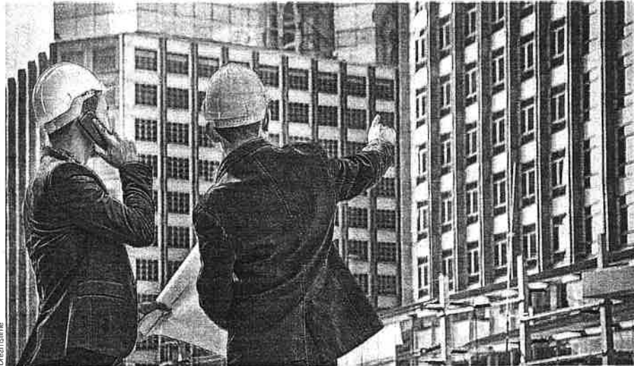
El Gobierno quiere modificar la cotización de 2,6 millones de autónomos para que contribuyan en función de sus ingresos reales.

El presidente de ATA sostiene que, en 2023, un autónomo no puede pagar 2.400 euros de cuota al año, que es el resultado de multiplicar 200 euros por doce meses, cuando sólo ingresa 3.000 euros. Ni tampoco al final del periodo, 14.640 euros por ingresar 49.000 euros al año. Amor