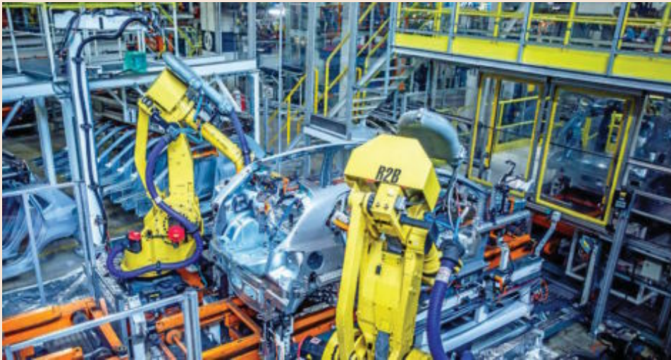
La industria ha crecido de forma ininterrumpida los últimos tres años gracias al aprovechamiento de la maquinaria ya instalada.

El nuevo Plan Renove daría respuesta a algunas de las medidas incluidas en el Pacto de Estado por la Industria, firmado entre el Ejecutivo y las principales patronales. Este documento hablaba, por ejemplo, de la necesidad de implementar medidas de apoyo al sector manufacturero para "garantizar